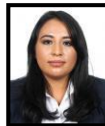
Dip. Olga Catalán Padilla