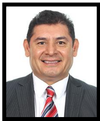
Dip. Alejandro Armenta Mier