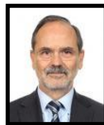
Dip. Gustavo Enrique Madero Muñoz