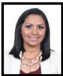
Dip. Araceli Saucedo Reyes